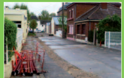
Les branchements gaz électricité rue Eugène Desprès