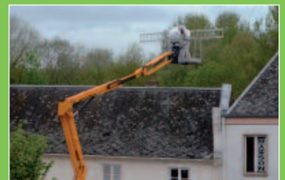
La démolition au 52 rue Victor Hugo