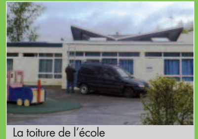
La toiture de l'école