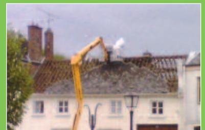
Les travaux avancent...